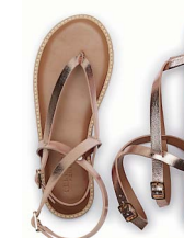
Gladiatorsandaler, Selected Femme, 600 kr.