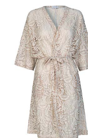
Blondekimono, Second Female, 799 kr.