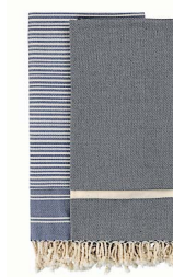
Strandhåndklæder, Becksøndergaard, 399 kr. for to stk.