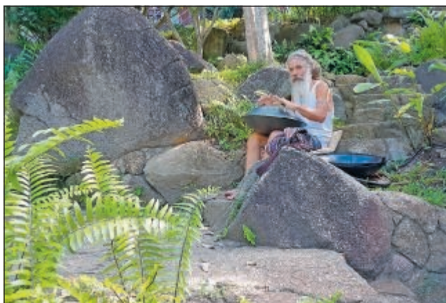
Der er altid autentisk live-musik, når man spadserer rundt i parken, der hører til Kamalaya.

Gæsternes navne er ændret i artiklen. Børsen var inviteret af Kamalaya Resorts