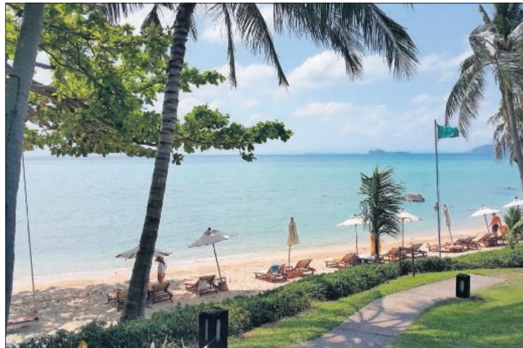
Den smukke, private sandstrand hører til resortet, der ligger på den sydlige del af øen Koh Samui.