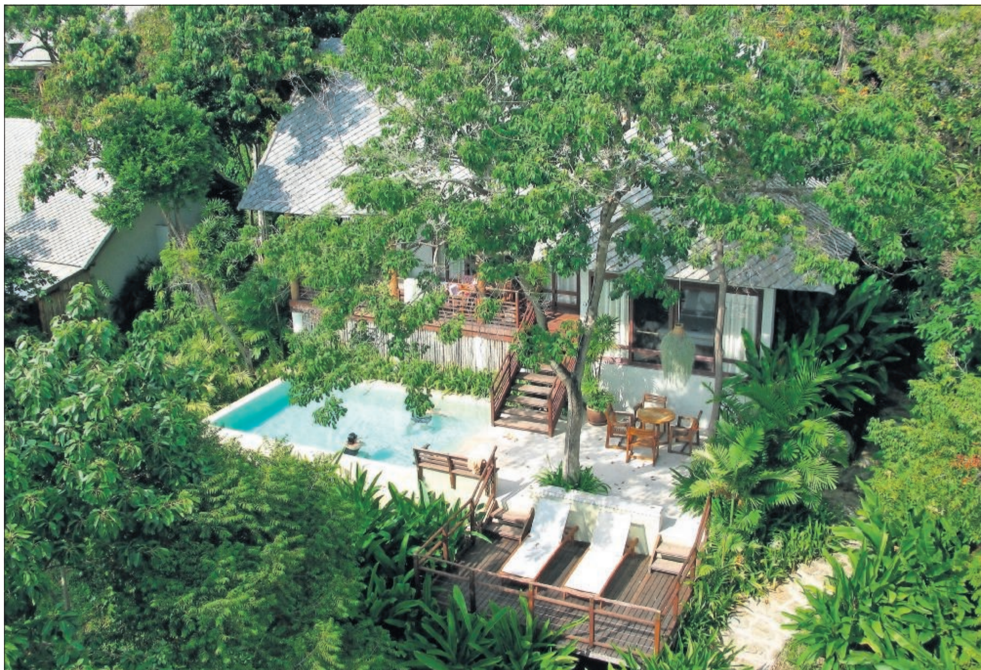
Flere af de populære bungalows har egen plunge pool, hvor man kan leve helt adskilt fra de andre gæster på resortet.