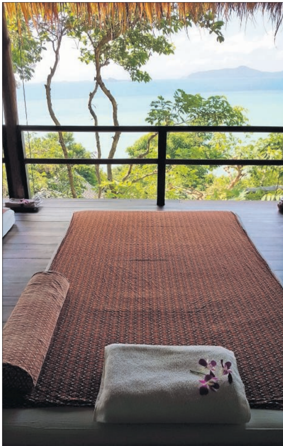
Som gæst på Kamalaya kan man dagligt nyde den mest storslåede udsigt fra terrassen.