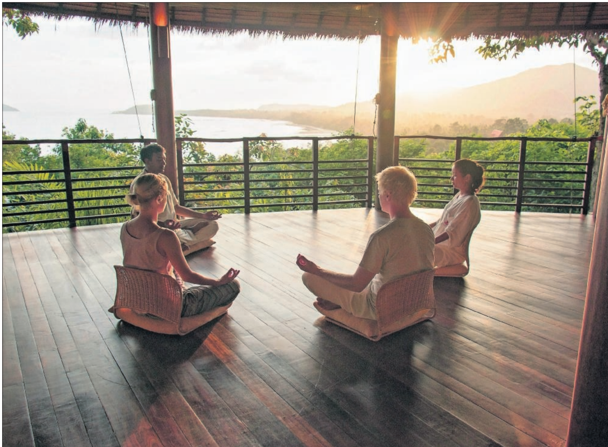
Samtlige gæster på Kamalaya får en samtale med en personlig helbredsvejleder, der bl.a. sammen sætter et personligt program med eksempelvis yoga- og meditationstimer.