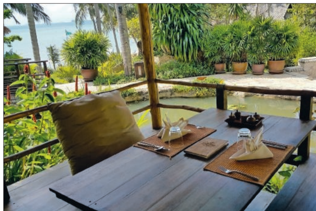
Ved frokostbordet falder man enten i snak med de andre gæster – eller falder i staver over udsigten.