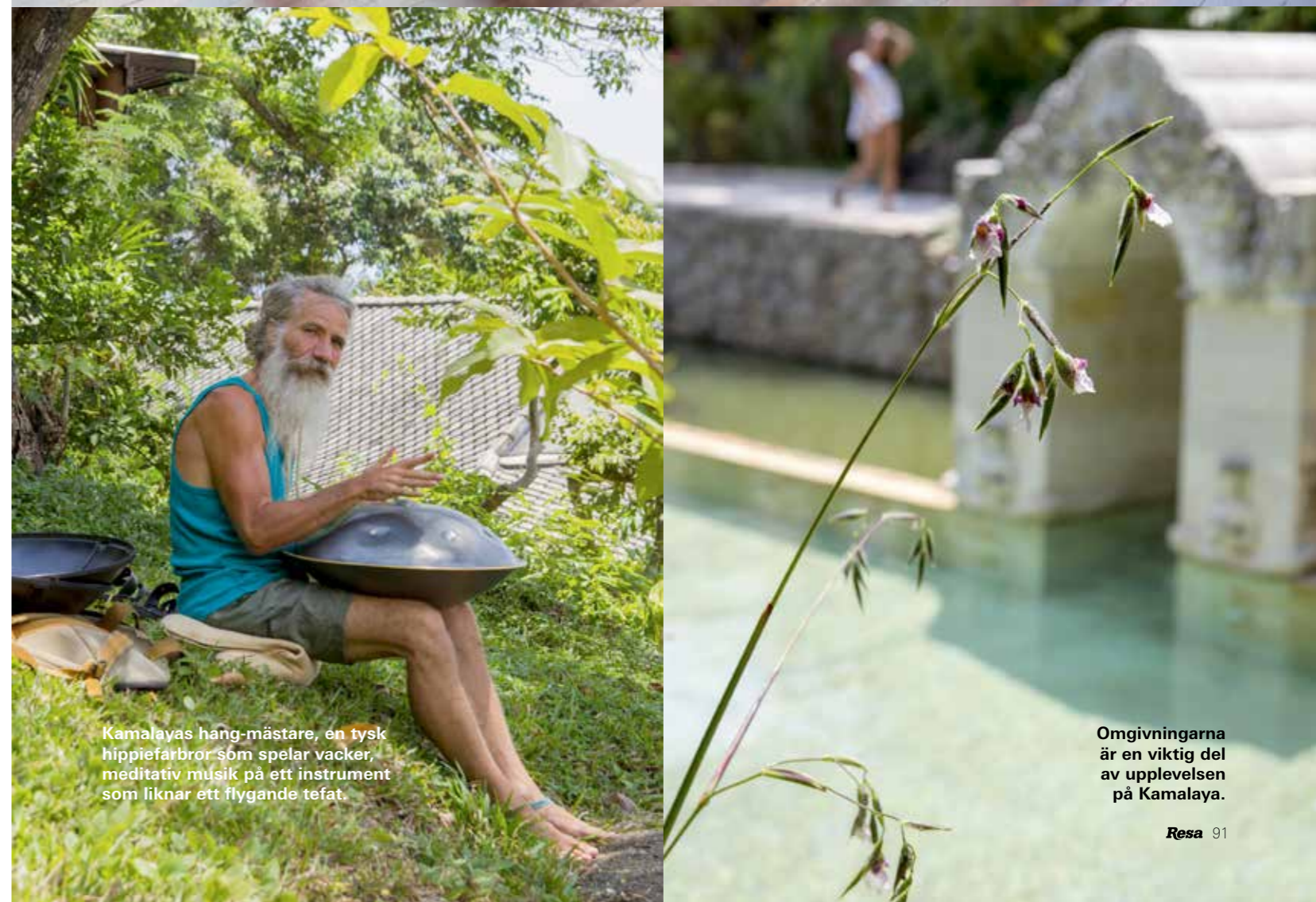
Kamalayas hang-mästare, en tysk hippiefarbror som spelar vacker, meditativ musik på ett instrument som liknar ett flygande tefat.