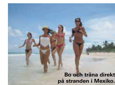
Bo och träna direkt på stranden i Mexiko.