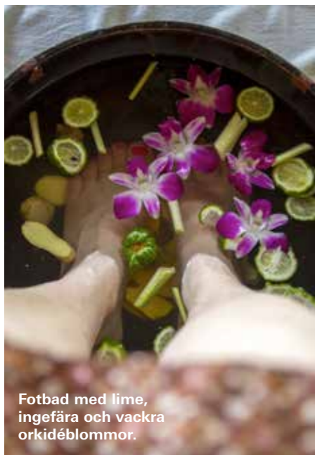
Fotbad med lime, ingefära och vackra orkidéblommor.