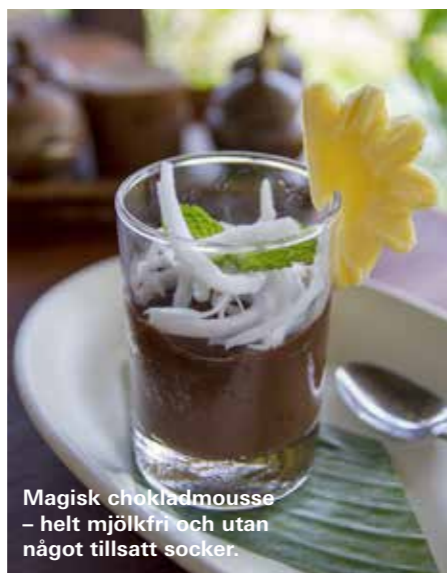
Magisk chokladmousse – helt mjölkfri och utan något tillsatt socker.

– Jag var en sådan som kunde gå fram till folk och fråga om de behövde en lever, eller kanske lite av mitt blod, säger hon och skrattar. Sedan köpte jag några stenar som skulle göra mig mer grundad och gick med dem i fickorna ett tag, men det blev lite väl tungt. Fast nu börjar jag hitta en bra balans, säger Duong och