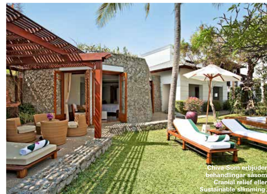
Chiva-Som erbjuder behandlingar såsom Cranial relief eller Sustainable slimming.

Rawfood, reiki, yoga och hypnos är några av ingredienserna som ska bidra till bättre hälsa, förbättrad fertilitet och viktminskning efter en vistelse på detta retreat bland böljande kullar i Cornwall i södra England. Här bor man i en