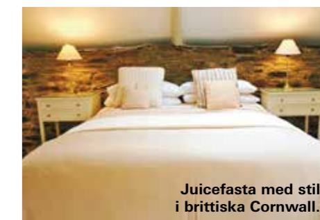
Juicefasta med stil i brittiska Cornwall.