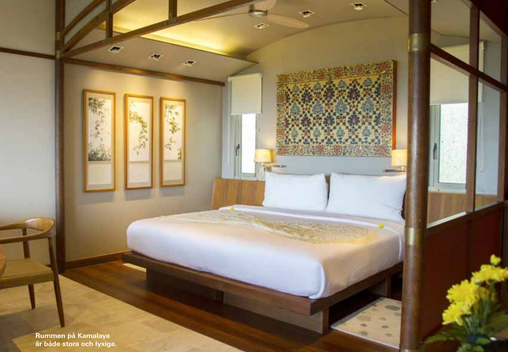
Rummen på Kamalaya är både stora och lyxiga.

verktyg för att själva kunna genomgå de förändringar de behöver. När man är här är det enkelt att träna, äta bra och känna sig harmonisk, men väl hemma igen är det svårare. Fast om du har haft en positiv upplevelse och mått bra när du var här så kanske någon del följer med tillbaka hem till vardagen. Det kan räcka med att dricka två koppar kaffe i stället för tre, då är vi nöjda.